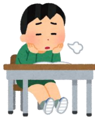
げんき 元気がない