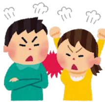
けんか 喧嘩、いらいら