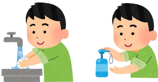
てあら こまめな しょうどく 手洗い・消毒